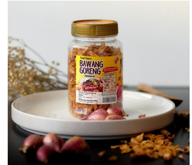
Bawang Goreng Premium Villa

Rendang Padang Kemfood merupakan rendang siap santap yang bisa disimpan di suhu ruang. Menggunakan resep asli Bukit Tinggi, Sumatera Barat. Dimasak hingga kering, dan menghasilkan aroma yang unik dan cita rasa lezat.