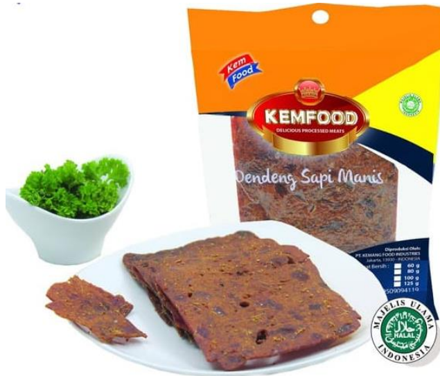
Dendeng Sapi Manis Kemfood

Perseroan selalu melakukan inovasi dan pengembangan produk baru untuk memperluas lini produk dan pilihan bagi konsumen. Produk – produk tersebut adalah produk siap santap yang merupakan produk kaya akan ciri khas nusantara.