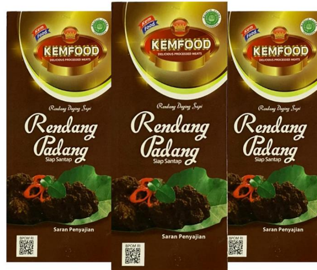
Rendang Padang Kemfood

Dendeng Sapi Manis Kemfood mengandung gizi dan protein yang tinggi, terbuat dari daging sapi pilihan yang diolah secara higienis sesuai dengan standar Internasional. Produk ini adalah produk siap santap yang dapat disimpan di suhu ruang.