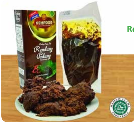
Rendang Padang Kemfood

Perseroan melakukan inovasi dan pengembangan produk baru untuk memperluas lini produk dan pilihan bagi konsumen. Produk – produk tersebut adalah produk siap santap yang merupakan produk kaya akan ciri khas nusantara. Diantaranya adalah: