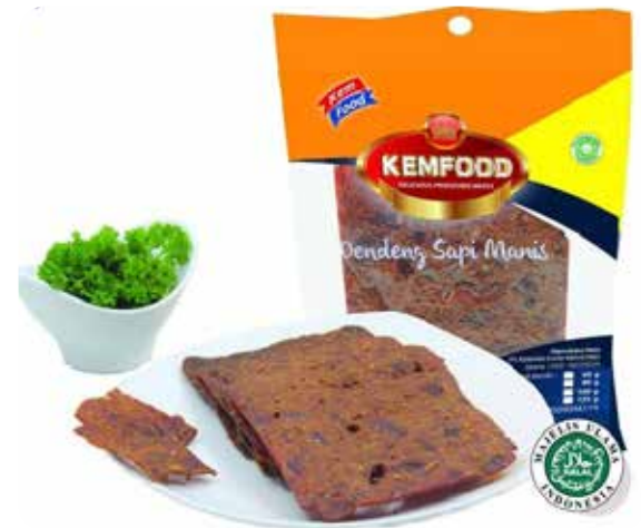
Dendeng Manis Kemfood